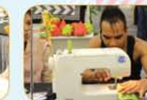
Aktiviti DIY sentiasa mendapat perhatian pengunjung daripada pelbagai bangsa, jantina dan peringkat umur/ DIY activities always get the attention of visitors from all races, genders and ages.