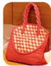
Beg Tangan Mesh Kuil