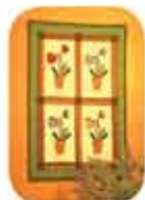
Hiasan Dinding Orkid