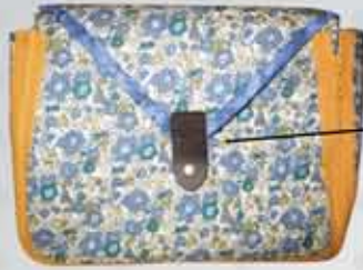
Beg Tangan/ Handbag