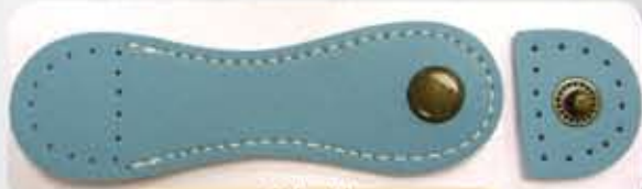
Color Blue ACS0725BL- RM12.00 (each)