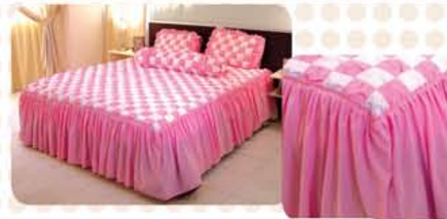
Cadar 'Sweet Rose'/ Sweet Rose Bedspread Set Harga Bahan/ Price of Material > PRO 0038 – RM207.00 VIP (20PV)