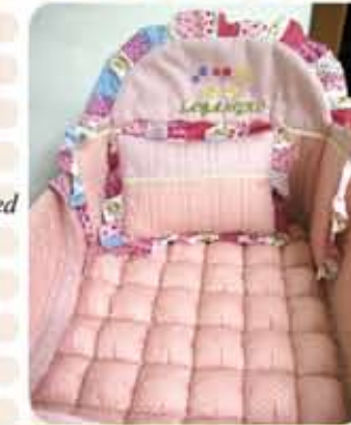
Contoh pengaplikasian teknik pada Tilam Bayi/ Technique applied on Baby Bedsheet