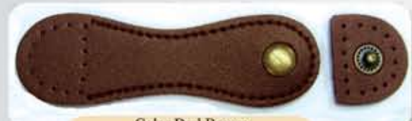
Color DarkBrown ACS0725DB- RM12.00 (each)