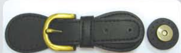
Color Black ACS0726 - RM29.00 (each)

Dapatkan produk-produk ini di Pusat Epal berhampiran anda. Boleh juga membuat pembelian secara atas talian di www.epal.com.my dan klik pada logo 'e-store'.