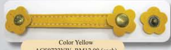
Color Yellow ACS0722YW- RM12.00 (each)