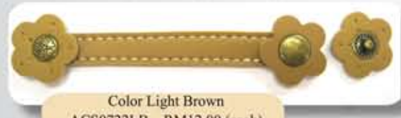
Color Light Brown ACS0722LB - RM12.00 (each)