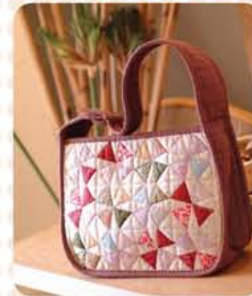
Beg Patchwork Bunga Api/ Fireworks Patchwork Bag Harga Bahan/ Price of Material > PRO 0039 – RM108.00 VIP (10PV)