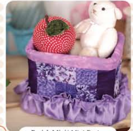
Projek Mini/ Mini Project: Bakul Biskuit Kuilt