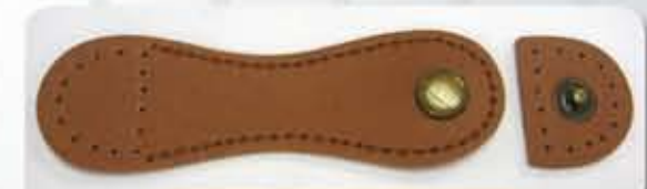
Color Light Brown ACS0725LB - RM12.00 (each)