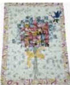
Hiasan Dinding Teknik Water Color