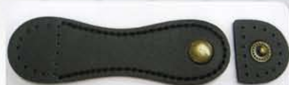
Color Black ACS0725BK - RM12.00 (each)