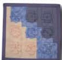
Origami Wall Hanging