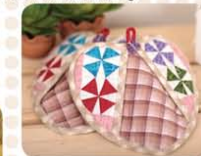
Projek Mini/ Mini Project : Pemegang Periuk Bunga Api