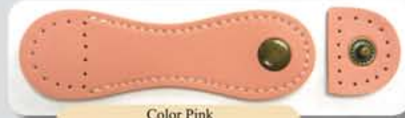
Color Pink ACS0725PK - RM12.00 (each)