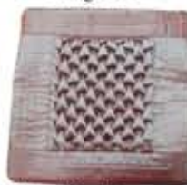
Smocking Sarung Kusyen Ekor Ikan

Kunjungi Pusat Epal untuk sertai kursus ini / Visit the nearest Epal Centre to take this course.