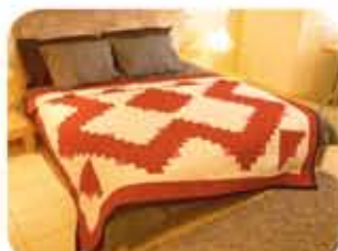
Selimut Log Cabin