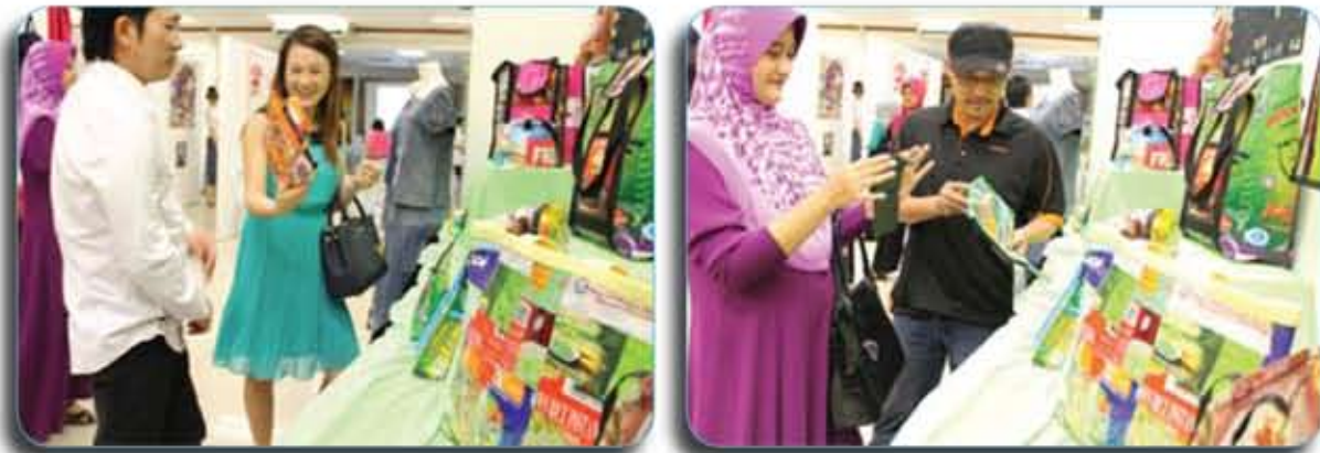
Antara reaksi jemputan yang hadir ketika melihat plastik minuman yang telah dikitar-semula menjadi beg/ The attendees' reaction when they saw the plastic beverage sheets that had been re-cycled to be bag.

In addition, rag sewing activity among the VIPs contributed to realize the effort to break the record. It is hoped that such efforts can open the minds of society to unite and create history.