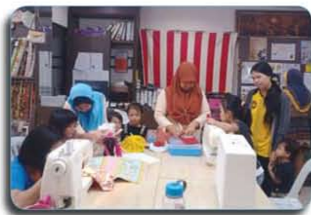
Kanak-kanak sedang belajar menjahit/ Kids learned to sew: My 1st Ali Baba Pant & My 1st Tote Bag.