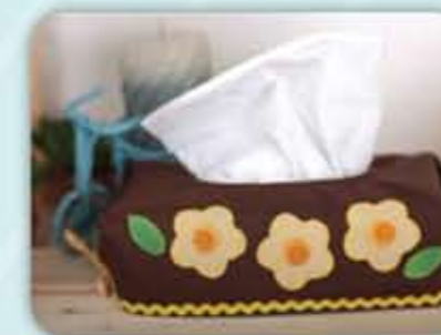
PROJEK MINI / MINI PROJECT: SARUNG KOTAK TISU / TISSUE BOX COVER