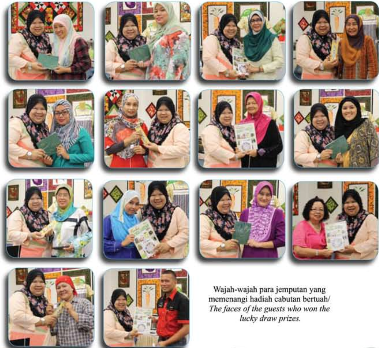
Wajah-wajah para jemputan yang memenangi hadiah cabutan bertuah/ The faces of the guests who won the lucky draw prizes.