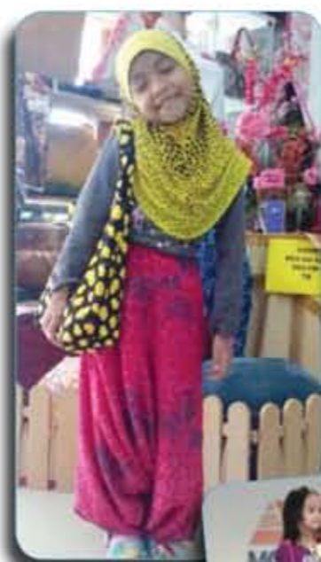
Hari terakhir program: Pertunjukan Fesyen yang memperagakan hasil jahitan sendiri untuk kanak-kanak/ Last day programme: Fashion Show for kids to show up their handmade products.