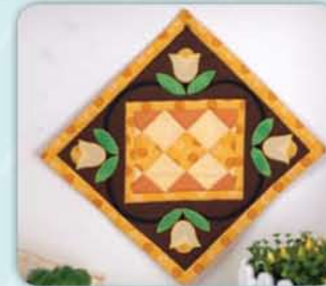
PROJEK MINI / MINI PROJECT: ALAS PINGGAN BUNGA TULIP / TULIP FLOWER PLATE MAT

ALAS MEJA SEPANJANG MASA / ALL TIME GREAT TABLE RUNNER HARGA BAHAN / PRICE OF MATERIAL : PRO 0145 - RM139.00 (VIP) (101PV)