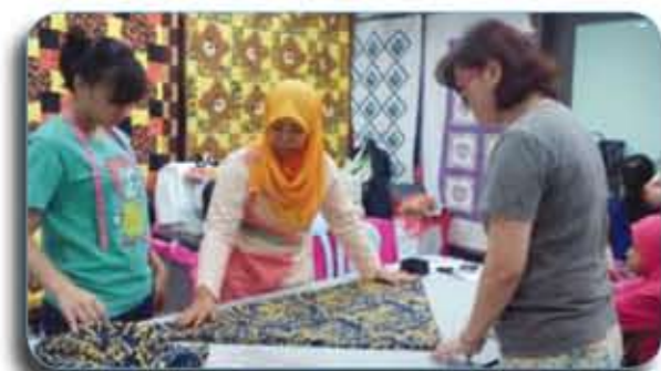
Para Ibu sedang belajar menjahit/ Mummies learned: Ali Baba Pants & Tote Bag.