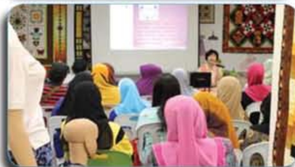
Sekitar taklimat berlangsung/ A round of briefing.