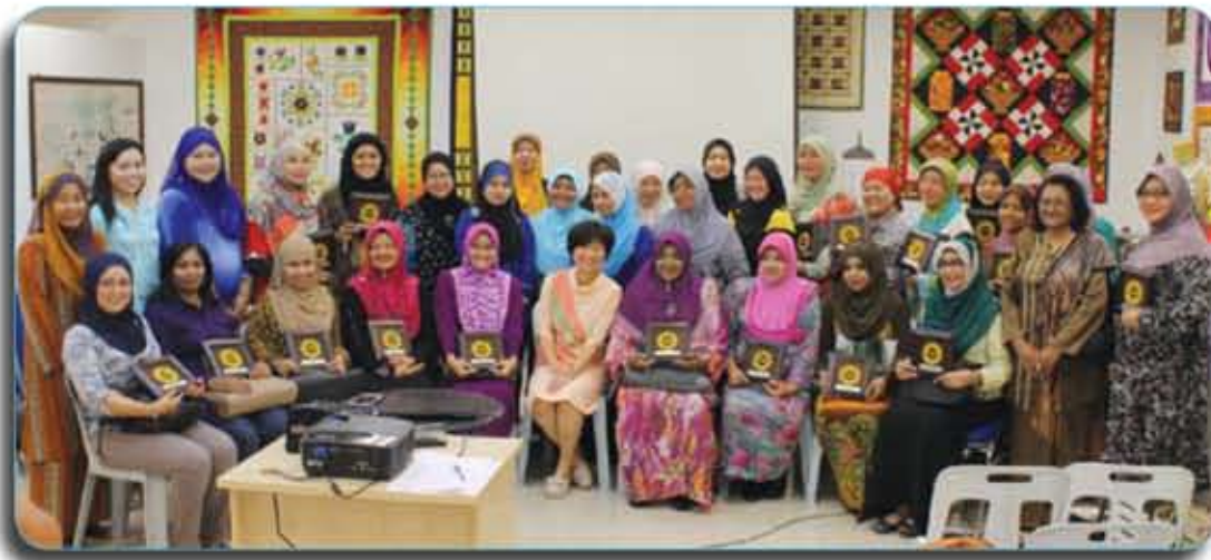
Sesi fotografi bersama semua jemputan/ Photography session with all associations.