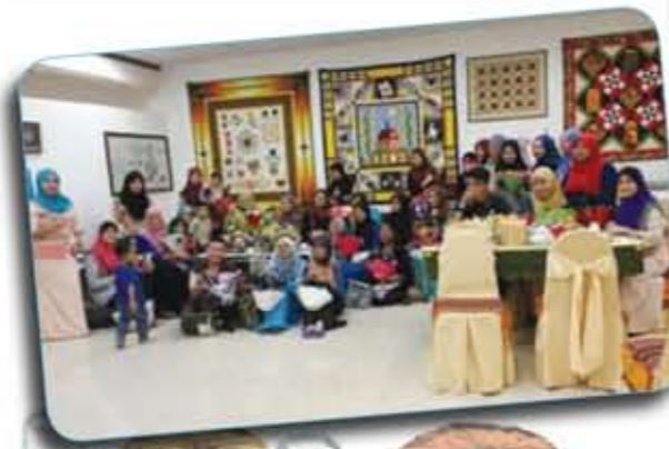
Photo: Penghargaan dari Mostwell kepada Kolej Komuniti Sabak Bernam/ Photo: Appreciation from Mostwell to Sabak Bernam Community College.