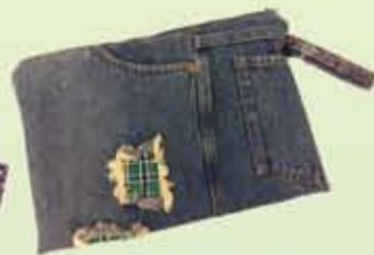
Kitty Bag for Ipad/ Tablet Cover