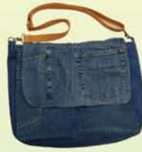
Cutie Sling Bag