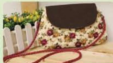
Lady Bag (Quilt)