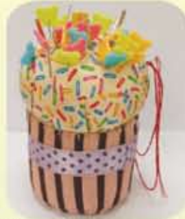
Cup Cake Pin Cushion