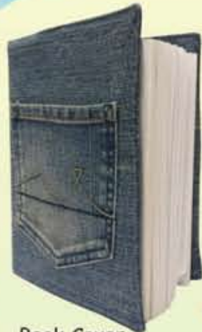
Book Cover (Jeans)