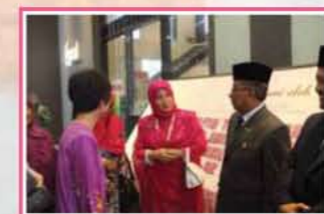
TPP selesai menandatangani plak SWG / TPP completed the signature on SWG Signboard