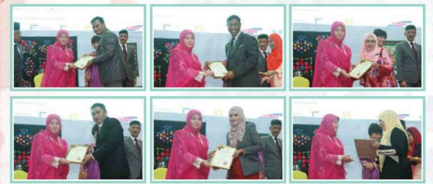
Penyerahan Sijil Lantikan Smart Partner / Handover Certificate of Appointment Smart Partner