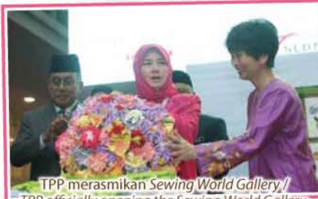
TPP merasmikan Sewing World Gallery / TPP officially opening the Sewing World Gallery.