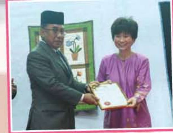
Penyerahan Sijil Jabatan Pembangunan Kemahiran kepada Mostwell Sdn Bhd. / Certificate Presentation Skills Development Department to Mostwell Sdn Bhd