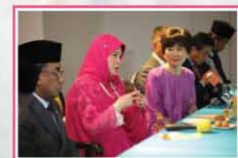
Sesi Menemuramah / Interview Session