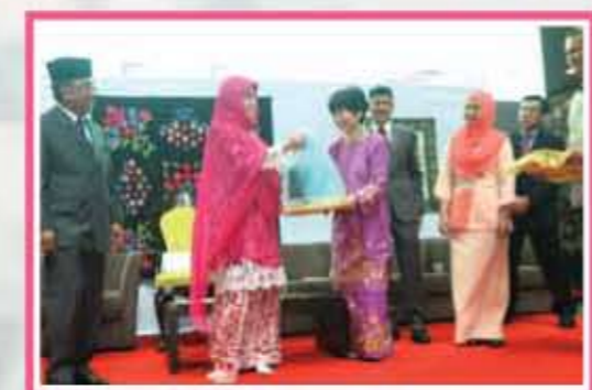
Pemberian cenderahati dari Mostwell kepada TPP / Giving souvenirs for TPP from Mostwell.