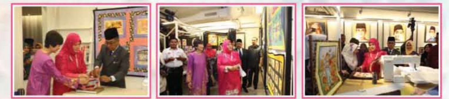
TPP melawat Sewing World Gallery / TPP visited Sewing World Gallery