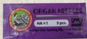
Jarum 14/Needle 14