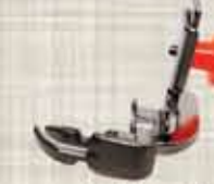
Tapak Zip Paiping/ Piping Zipper Footer