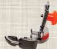
Tapak Zip Paiping/ Piping Zipper Footer