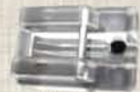
Tapak Zip Sembunyi/ Hidden Zipper Footer