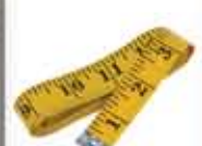
Pita Ukur/ Measuring Tape