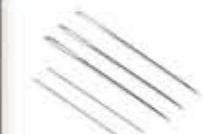
Jarum Jahit Tangan/ Hand Sewing Needle