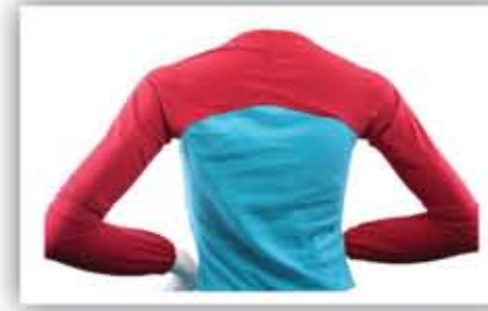
Awning Lengan / Arm Awning

Harga bahan / Material price PRO 0143- RM64.70 (incl. GST 6%)