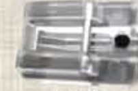
Tapak Zip Sembunyi/ Hidden Zipper Footer