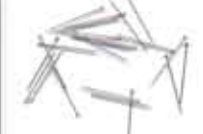
Jarum Peniti/ Needle pins