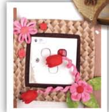
Bingkai Soket / Socket Frame