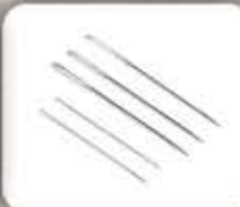
Jarum Jahit Tangan/ Hand Sewing Needle