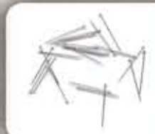
Jarum Peniti/ Needle pins