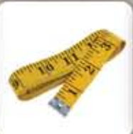
Pita Ukur/ Measuring Tape