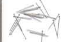
Jarum Peniti/ Needle pins