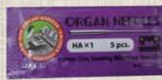
Jarum 18/Needle 18