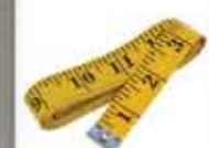
Pita Ukur/ Measuring Tape